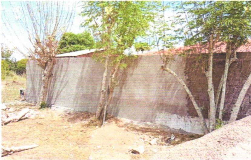
FOTO 09 - MASSA ÚNICA, EM ARGAMASSA INDUSTRIALIZADA, PREPARO MECÂNICO, APLICADA COM EQUIPAMENTO DE MISTURA E PROJEÇÃO DE ARGAMASSA EM PAREDES INTERNAS, E = 5MM, SEM TALISCAS. AF_03/2024