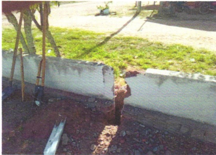
FOTO 01 - ESCAVAÇÃO MANUAL PARA BLOCO DE COROAMENTO OU SAPATA (INCLUINDO ESCAVAÇÃO PARA COLOCAÇÃO DE FÔRMAS). AF_01/2024