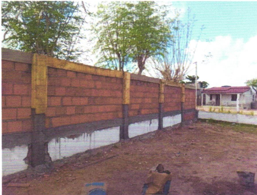
FOTO 07 - FABRICAÇÃO DE FÔRMA PARA PILARES E ESTRUTURAS SIMILARES, EM CHAPA DE MADEIRA COMPENSADA PLASTIFICADA, E = 18 MM. AF_09/2020