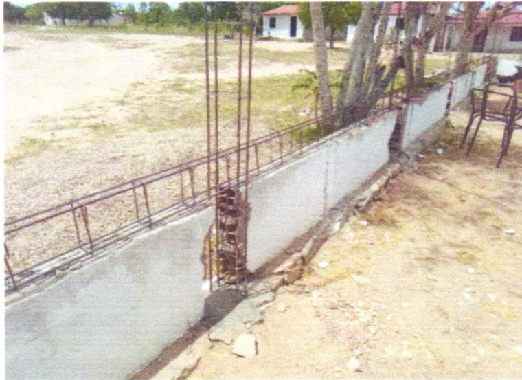
FOTO 03 - ARMAÇÃO DE PILAR OU VIGA DE ESTRUTURA CONVENCIONAL DE CONCRETO ARMADO UTILIZANDO AÇO CA-50 DE 10,0 MM - MONTAGEM. AF_06/2022