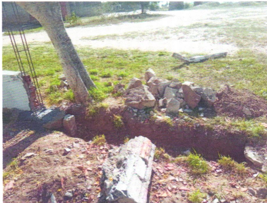
FOTO 11 - DEMOLIÇÃO DE ALVENARIA DE BLOCO FURADO, DE FORMA MANUAL, SEM REAPROVEITAMENTO. AF_09/2023